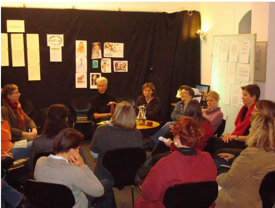
Diskussion auf dem PorNo-Day